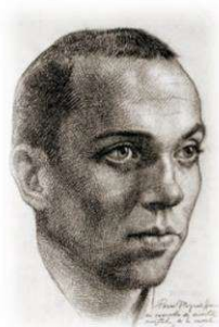
Miguel Hernández. Dibujo que le hizo Buero Vallejo en la prisión de Toreno en 1940.