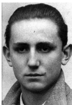
Antonio Buero Vallejo, con 18 años.